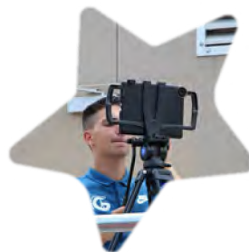
Matches en direct